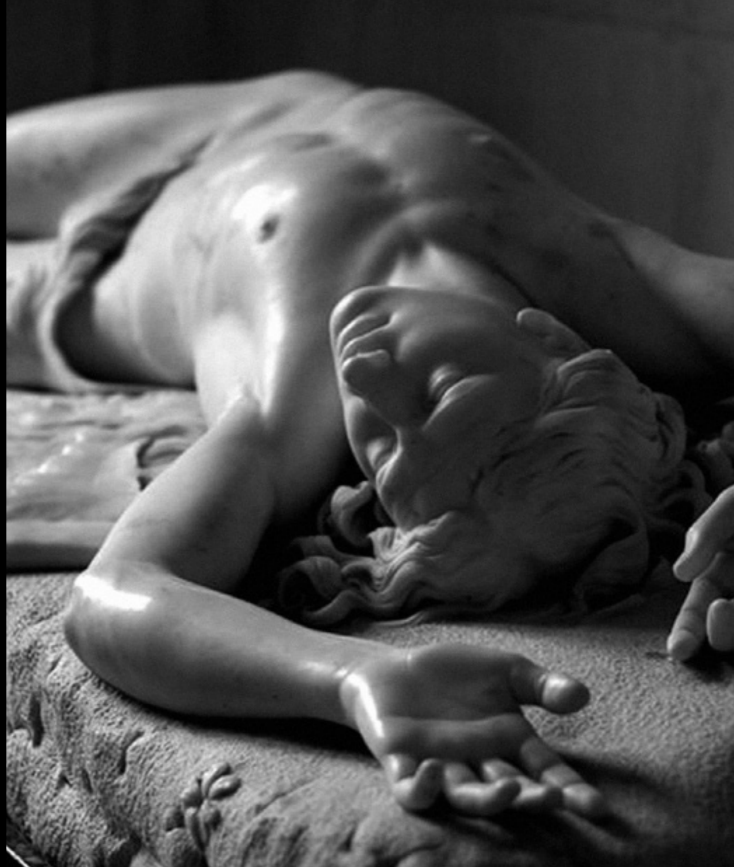
Джованни Дюпре. Авель Италия. 1844. Мрамор.

Участие в выставках, круглых столах, имиджевых проектах Государственного Эрмитажа в России и за рубежом