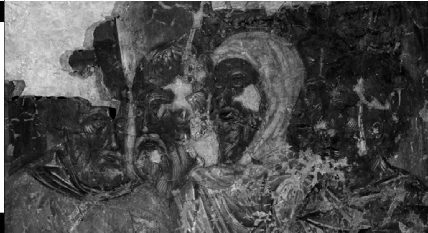
Фрески из Довмонтова города

Тираж: 10 000 экземпляров Периодичность: 2 раза в год Язык: английский, русский Формат: 231 x 285 Объем: до 264 полос