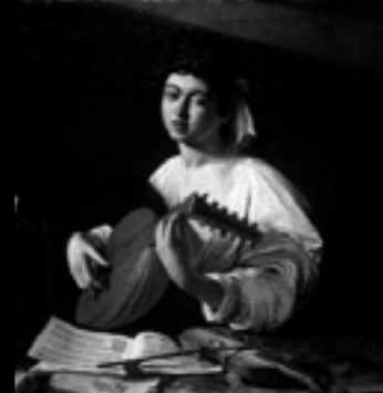
Караваджо (Микеланджело Меризи Караваджо). Юноша с лютней Холст, масло. 94x119 см Италия. Около 1595

Участие в ключевых российских и международных мероприятиях: Российский Антикварный салон, Московский Международный Салон изящных искусств, Sotheby's, Арт-Москва, Венецианская биеннале (Италия), Vienna Fair (Австрия), Art Basel, Baselworld (Швейцария), Frieze Art Fair (Лондон), Art London, FIAC, Biennale des Antiquaires (Париж), Маастрихтская арт-ярмарка (Нидерланды), Шанхайская выставка (Китай)