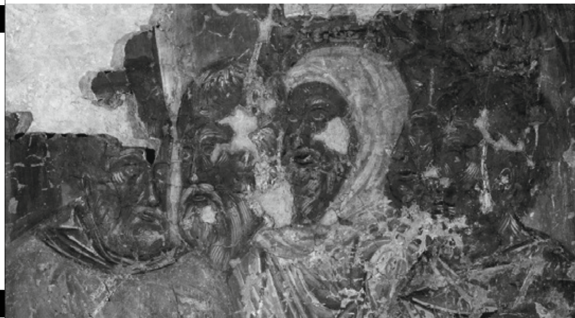
Фрески из Довмонтова города

Печатных и цифровых копий: 20 000 Периодичность: 2 раза в год Язык: русский Формат: 231 x 285 Объем: до 264 полос