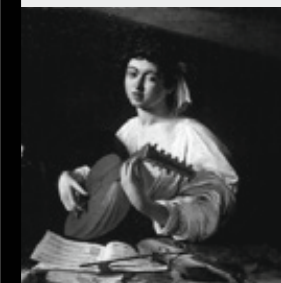
Караваджо (Микеланджело Меризи Караваджо). Юноша с лютней Холст, масло. 94x119 см Италия. Около 1595

Участие в ключевых российских и международных мероприятиях: Российский Антикварный салон, Московский Международный Салон изящных Искусств, Sotheby's, Арт-Москва, Венецианская биеннале (Италия), Vienna Fair (Австрия), Art Basel, Baselworld (Швейцария), Frieze Art Fair (Лондон), Art London, FIAC, Biennale des Antiquaires (Париж), Маастрихтская ярмарка (Нидерланды), Шанхайская выставка (Китай), Форум объединенных культур, Интермузей, ИКОМ, Дни Эрмитажа (РФ, Сербия)