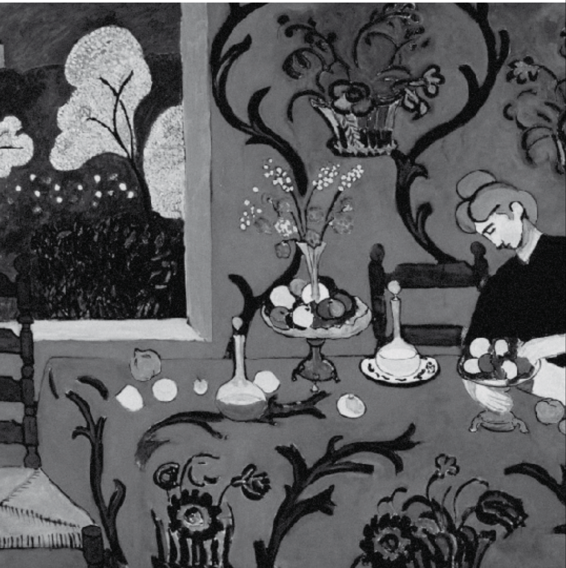
Анри Матисс. Красная комната Холст, масло. 180.5x221 см. Франция. 1908