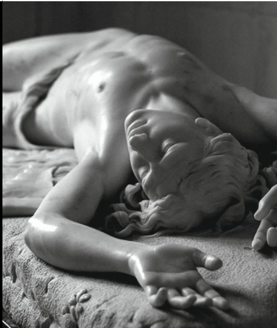
Джованни Дюпре. Авель Италия. 1844. Мрамор.

Участие в выставках, круглых столах, имиджевых проектах Государственного Эрмитажа в России и за рубежом